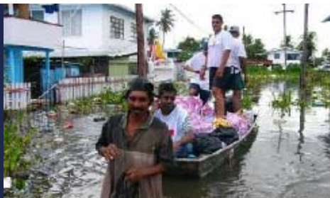
Severe flooding in Guyana in January 2005 was the result of the ITCZ interacting with a surface trough which reduced the streets to waterways, accessible only by boat.

❖ Basura Electrónica El impacto de las nuevas tecnologías